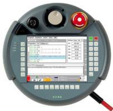
neues PHG für die rcs1

Wir freuen uns, Ihnen ein neues Produkt aus dem Hause robolab vorstellen zu können. Ab sofort liefern wir unsere Robotersteuerung rcs1 mit einem neuen Programmierhandgerät (PHG) aus. Auf Basis der Hardware KeTop T50 aus dem Hause KEBA haben wir eine maßgeschneiderte Bedienoberfläche für unsere rcs1 entwickelt. In der Planung des Produktes haben wir großen Wert auf Kundenfeedback gelegt, um eine bedienerfreundliche Lösung anbieten zu können.