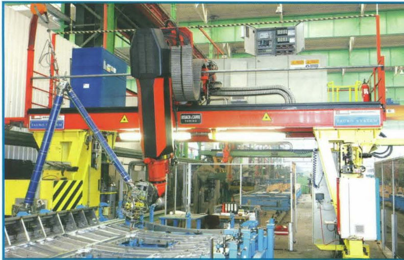
Produktion von Stahlpaneelen: Die Portalschweißanlage ermittelt anhand von CAD-Daten und Bildauswertungsverfahren selbsttätig den Verlauf der Nähte, die in den Prozess integrierte Sensorik sorgt für eine exakte Verfüllung und eine saubere Schweißraupe auch bei ungenau positionierten Platten.

boter und Objektoberfläche zustande. Durch die Krafrückführung reagiert die Kraftregelung auch bei Werkstückvibrationen robust, dabei sind die Kontaktkräfte zwischen Werkzeug und Werkstück über vier Größenordnungen hinweg einstellbar.