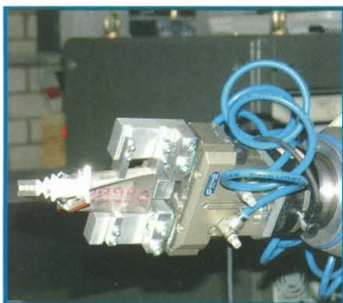
Mit dem „robolab sensing system“ kann ein Greifer auch Teile sicher fassen, deren Position nur ungenau bekannt ist.

Deren RCM-Steuerungen waren ursprünglich von Siemens entwickelt worden. Dies bewegte die Unternehmensgründer, mit dem Hersteller Kontakt aufzuneh-